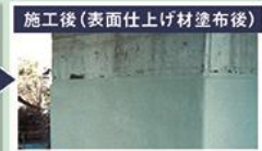
施工後(表面仕上げ材塗布後)