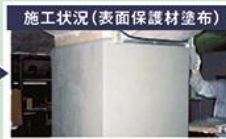
施工状況(表面保護材塗布)