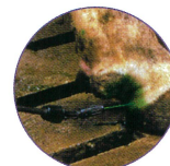
希釈液をスプレー